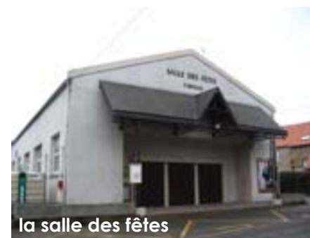
la salle des fêtes