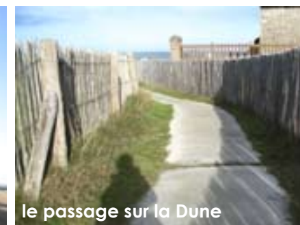
le passage sur la Dune

• Créer une ouverture visuelle vers la mer depuis le chemin des Pêcheurs