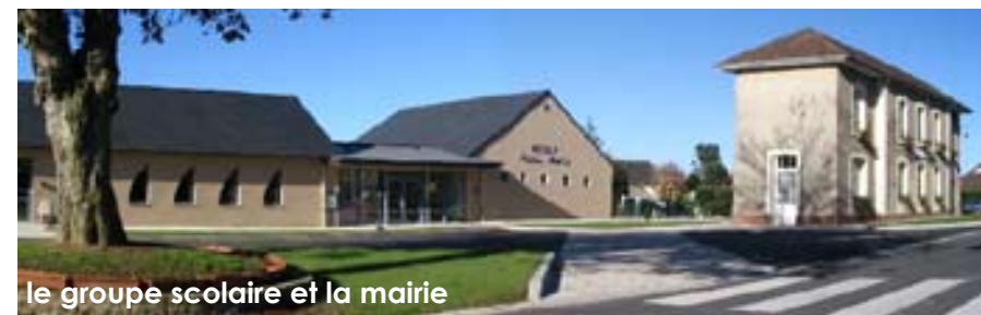
le groupe scolaire et la mairie