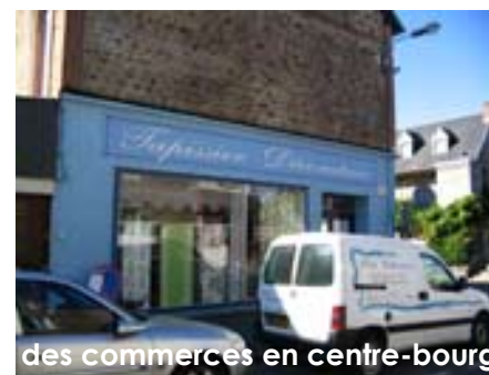
des commerces en centre-bourg