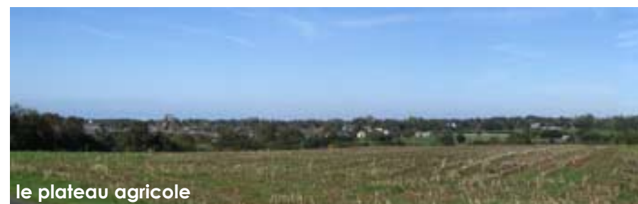
le plateau agricole