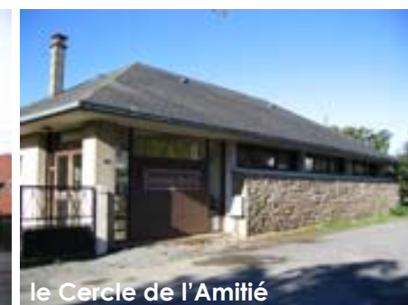
le Cercle de l'Amitié