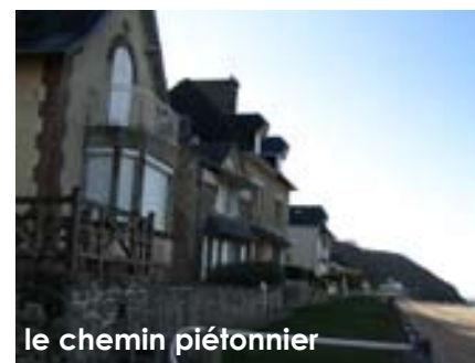
le chemin piétonnier

• Dynamiser le secteur bâti en pied de falaise en lui assurant une meilleure cohérence