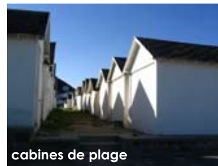
cabines de plage

• Maintenir, malgré la distance, une cohésion entre la plage et le bourg en créant des liaisons piétonnières et cyclistes sécurisées ou envisager la possibilité d'une navette entre le bourg et la plage