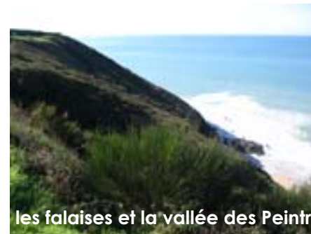
les falaises et la vallée des Peintres