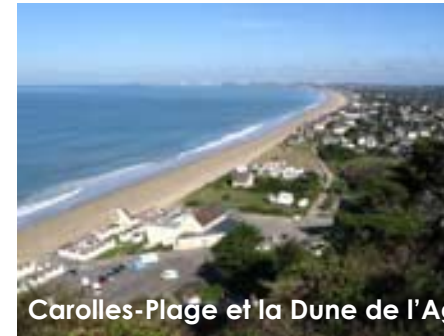
Carolles-Plage et la Dune de l'Agriculture